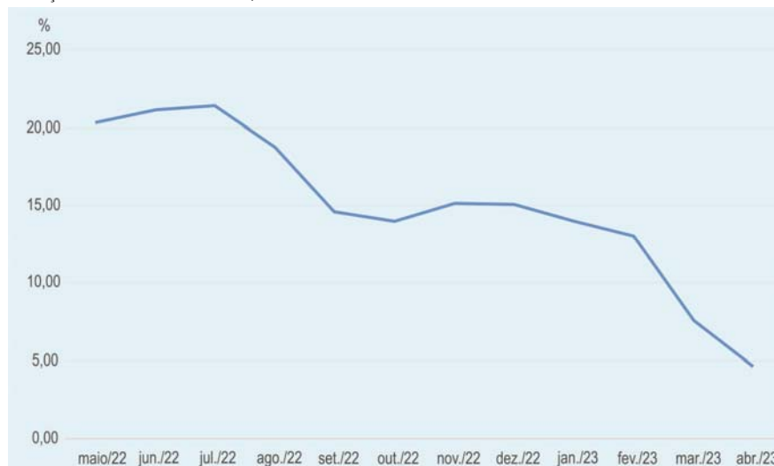
VARIAÇÕES PERCENTUAIS MENSIS, ACUMULADAS EM 12 MESES IPR - ALIMENTOS E BEBIDAS - PARANÁ

Regionalmente, dois municípios apresentaram taxas superiores ao acumulado do estado: Maringá e Londrina, com variações de 5,82% e 5,77%, respectivamente; na sequência vieram Cascavel (4,60%), Curitiba (4,01%), Foz do Iguaçu (3,97%) e Ponta Grossa (3,57%).