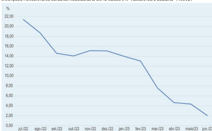
VARIAÇÕES PERCENTUAIS MENSIS, ACUMULADAS EM 12 MESES IPR - ALIMENTOS E BEBIDAS - PARANÁ

Nessa métrica, a maior variação regional entre julho de 2022 e junho de 2023 ocorreu em Maringá com 3,17%, seguida por Londrina com 2,40%, Cascavel com 2,26%, Curitiba com 2,18%, Foz do Iguaçu com 1,52% e Ponta Grossa com 0,49%.