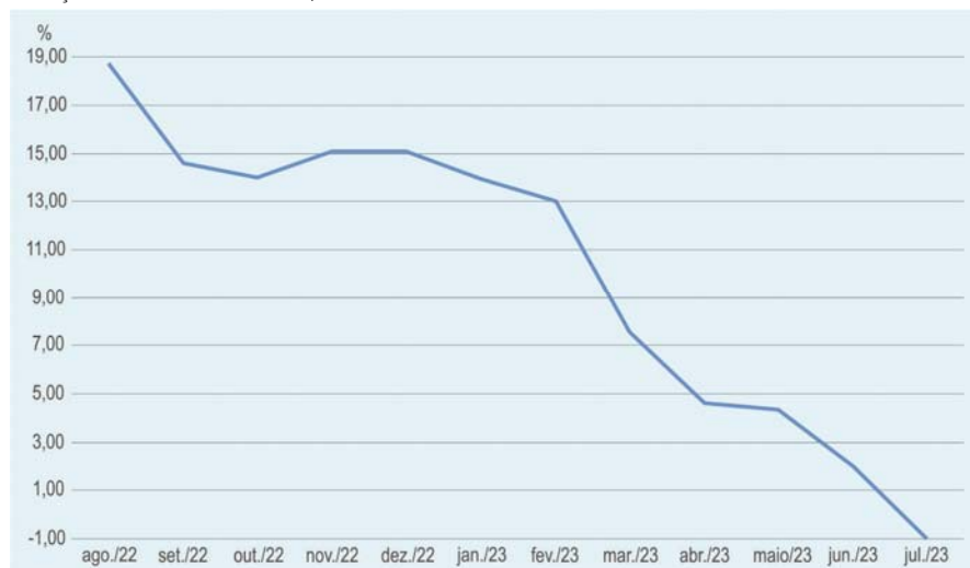
VARIAÇÕES PERCENTUAIS MENSAIS, ACUMULADAS EM 12 MESES IPR - ALIMENTOS E BEBIDAS - PARANÁ

Regionalmente, a variação acumulada para esse período foi de -1,80% em Ponta Grossa, -1,69% em Foz do Iguaçu, -1,26% em Cascavel, -0,48% em Curitiba, -0,46% em Londrina e -0,21% em Maringá.