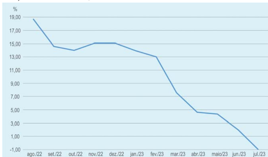
VARIAÇÕES PERCENTUAIS MENSASIS, ACUMULADAS EM 12 MESES IPR - ALIMENTOS E BEBIDAS - PARANÁ

Essa métrica revelou-se com retrações em todos os municípios. Em Ponta Grossa, a variação entre setembro de 2022 a agosto de 2023, foi de -2,42%, em Foz do Iguaçu (-2,16%), em Maringá (-1,76%) em Cascavel (-1,07%), em Londrina (-1,01%) e em Curitiba (-0,87%).