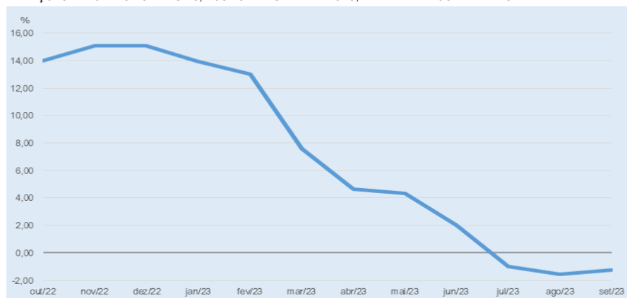
VARIAÇÕES PERCENTUAIS MENSASIS, ACUMULADAS EM 12 MESES, IPR - ALIMENTOS E BEBIDAS - PARANÁ

No âmbito regional, essa métrica revelou retrações de intensidade distintas. Ponta Grossa registrou, entre outubro de 2022 a setembro de 2023, queda de 2,15%, seguido por Foz do Iguaçu (-1,95%), Curitiba (-1,77%), Londrina (-1,50%), Cascavel (-0,24%) e Maringá (-0,01%).