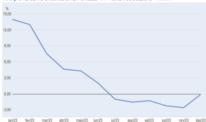
VARIAÇÃO PERCENTUAL ACUMULADA EM 12 MESES - IPR - ALIMENTOS E BEBIDAS - PARANÁ

Mesmo com o terceiro reajuste mensal consecutivo, o índice acumulado em 12 meses encerrou 2023 com variação de -0,14%, o menor resultado para o estado desde o início da série histórica.