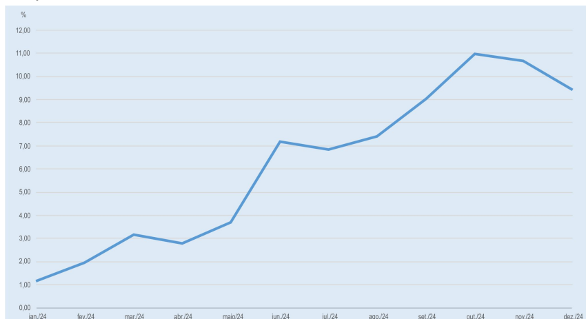
VARIAÇÃO PERCENTUAL ACUMULADA EM 12 MESES - IPR-ALIMENTOS E BEBIDAS - PARANÁ - JAN 2024-DEZ 2024

De toda forma, novembro e dezembro registraram variações menores frente aos mesmos períodos de 2023, influenciando na desaceleração do índice acumulado entre janeiro e dezembro de 2024.