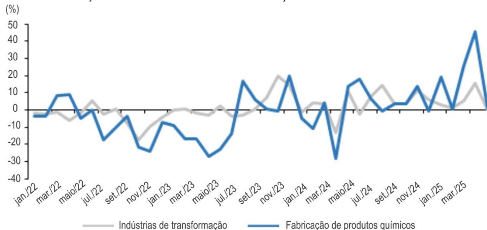
GRÁFICO 1 - VARIAÇÃO MÊS/MÊS DO ANO ANTERIOR DA PRODUÇÃO FÍSICA DA INDÚSTRIA QUÍMICA - PARANÁ