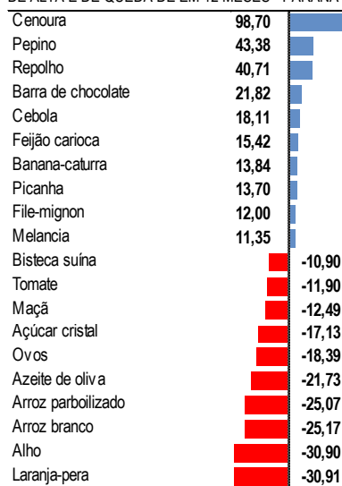
PRINCIPAIS ITENS COM VARIAÇÃO PERCENTUAL DE ALTA E DE QUEDA DE EM 12 MESES - PARANÁ